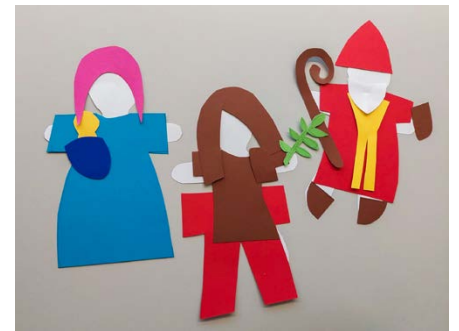
Kreative Momente erleben

Anfang Januar erfolgte durch Birgitta Aicher die Einladung, einen Nachmittag im Modul 19 zum Thema «Eucharistie und Abendmahl im integrativen Setting» zu gestalten. Der Nachmittag war intensiv und spannend, besonders als die Katechetinnen erzählten, unter welchen Bedingungen sie zum Teil unterrichten müssen.