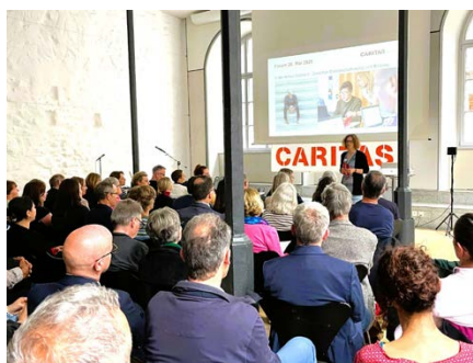
Forum Caritas Solothurn 2025: «Armutsbetroffene zwischen Existenzsicherung und Bildung»

2025 startete für Caritas Solothurn mit einer guten Nachricht für Armutsbetroffene aus dem Pastoralraum Olten: Seit Februar betreibt das Hilfswerk neben den Standorten in Solothurn und Grenchen zusätzlich in Olten eine Kirchliche Sozialberatung. Getragen wird das Angebot von der Römisch-katholischen Kirchengemeinde Olten/Starrkirch-Wil. Zweimal wöchentlich können Menschen in sozialen Notlagen die offene Sprechstunde aufsuchen.