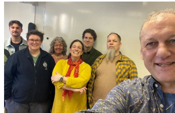
Die Fachstellenteams beim «Weihnachtsessen» am 7. März 2025

Den Schatz der Kirchenmusik bewahrt die Fachstelle Kirchenmusik mit grösster Sorgfalt. Dies zeigte sich auch am 8. Gregorianik-Projekt, das der Pflege der Wurzeln geistlicher Musik gewidmet war.