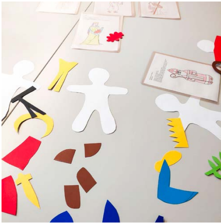
Werken und gestalten im Religionsunterricht