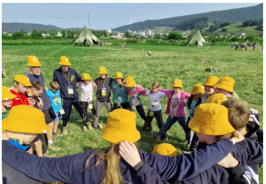
Impressionen vom Jublasurium 2025 in Wettingen