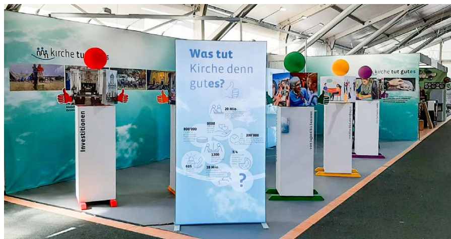
Gemeinsamer Auftritt der Landeskirchen an der HESO 2025 in Solothurn

Nach Jahren der engen ökumenischen Zusammenarbeit hat im Jubiläumsjahr 2025 die erste ökumenische Fachstelle Religionspädagogik der Schweiz im Kanton Solothurn ihre Arbeit aufgenommen. Mit dieser neuen Stelle stärken die Kirchen im Kanton die religiöse Bildung und die Religionslehrpersonen im Religionsunterricht. An der Herbstmesse Solothurn (HESO) wurden die gesamtgesellschaftlichen Leistungen der Landeskirchen unter dem Motto «kirche tut gutes» einer breiten Öffentlichkeit präsentiert.