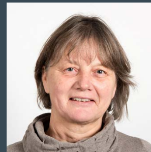
Theres Brunner Kommunikation & Öffentlichkeit