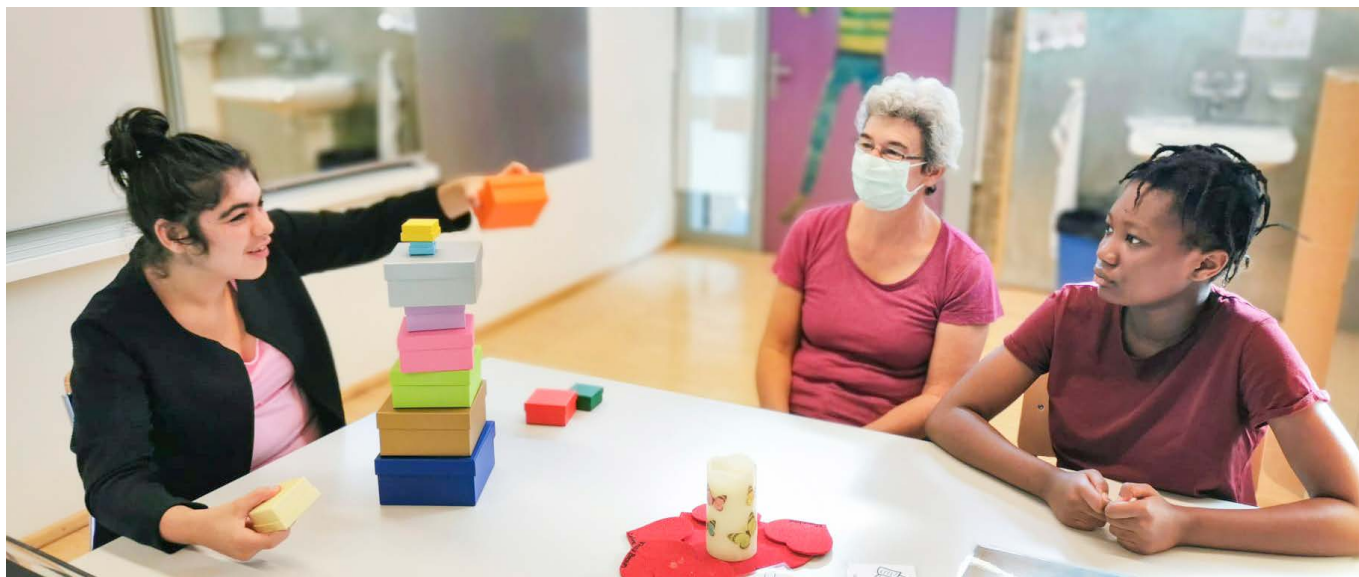
Situation aus dem heilpädagogischen Religionsunterricht während der Corona-Pandemie.