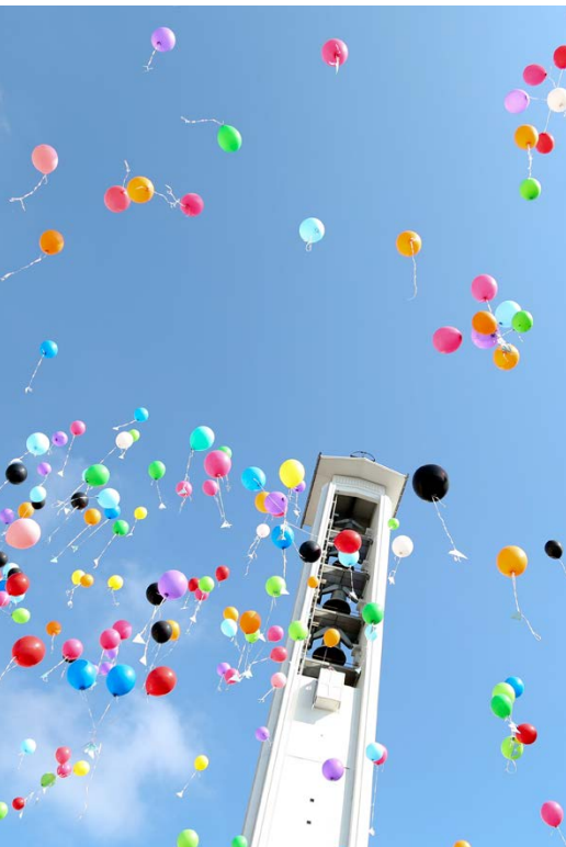
Titelbild «Jahresbericht 2012»

2016 befasst sich der Synodalrat einmal mehr mit der seit Jahren andauernden rückläufigen Zahl von Kirchenmitgliedern. Innert zehn Jahren hatte sich gesamtschweizerisch die Zahl der konfessionslosen Bevölkerung verdoppelt und die Taufen nahmen um rund 20 Prozent ab. In einem Workshop in Mariastein wurde die Situation analysiert und Zukunftsstrategien entwickelt. Gleichzeitig blieb auch das Thema «Finanzausgleichssteuer» omnipräsent. Mit Vehemenz pochten die Synoden darauf, beim neuen Finanzausgleich finanzielle Sicherheiten zu erhalten, damit die zahlreichen Leistungen für die Gesellschaft auch in Zukunft erfüllt werden können. Die breit angelegte Vernehmlassung zum «NFA – Neuen Finanzausgleich Kirchen» machte deutlich, wie stark das Thema Regierung, Kirchen, Kirchgemeinden, politische Parteien und natürlich die